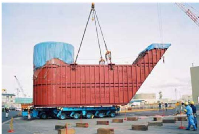
図 2.1.7 原子炉下部キャビティ室構造体

RWS T (Refueling Water Storage Tank) については、「用語・略語リスト（以下リンク）」に以下の説明がある。