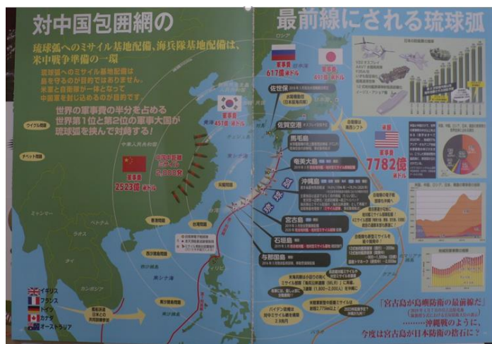
沖縄ドローンプロジェクト「琉球弧戦争と平和の最前線」より