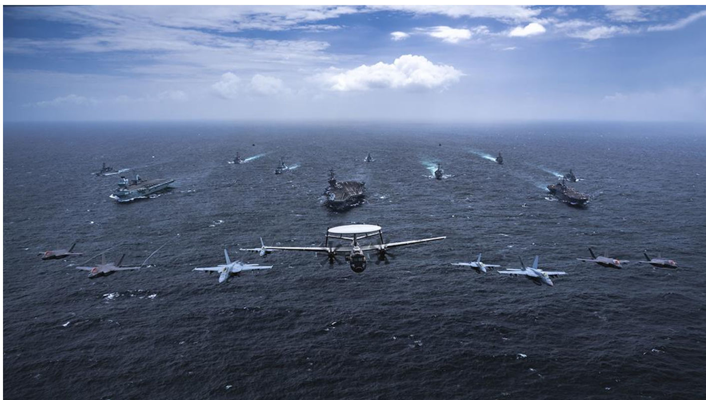
防衛省 HP より