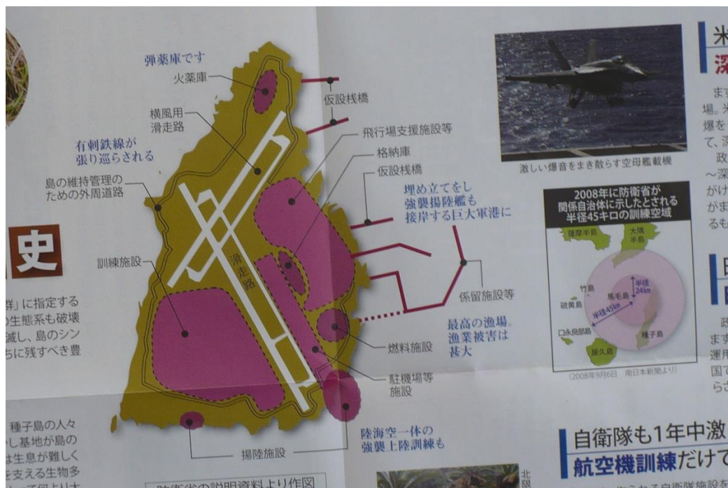
「馬毛島への米軍施設建設に反対する市民・団体連絡会」のリーフより